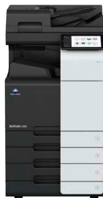
bizhub i-Serie C360i