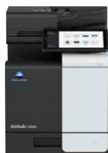
bizhub i-Serie C4050i

Wenn Ihr Unternehmen wächst, wachsen wir mit Ihnen. Wir verbinden Menschen und Orte nahtlos, um eine neue Dimension des Dokumenten-Workflows und Sicherheitsmanagements zu schaffen.